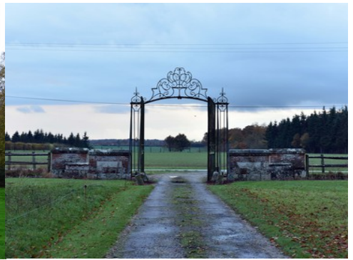
La perspective ouest vers la plaine