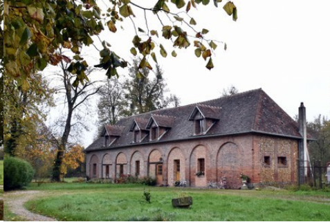
Un bâtiment des communs