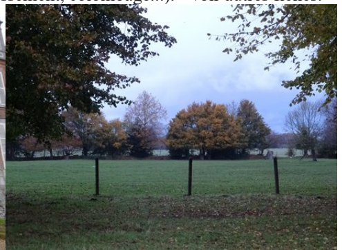
Les prairies alentours destinées à l'élevage