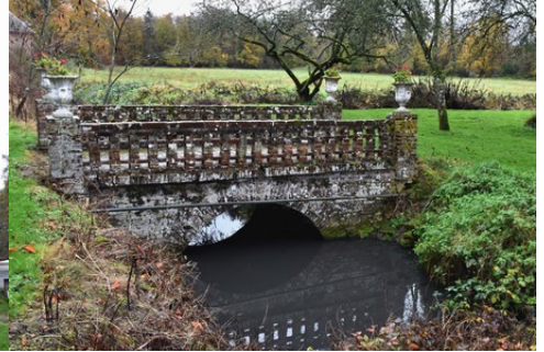
Un pont dans le parc

Pour la zone en rose foncé dans le périmètre de 500m