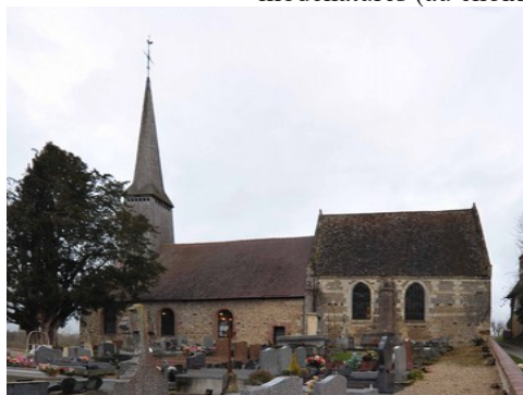
L'église de Saint Pierre de Cernières

Les avis seront cohérents avec ceux émis ces dernières années, à savoir : pas de maisons à volume compliqué (type V, W, Y, ou Z), Rez-de-chaussée + Combles, pentes à 45° pour les volumes principaux, ardoise ou tuile plate de teinte brun vieilli, à 20u/m², avec un débord de toiture de 20cm, enduit de teinte beige clair avec modénatures (au choix : chaînages, encadrement de fenêtres, soubassement, colombage...). *Voir autres fiches.