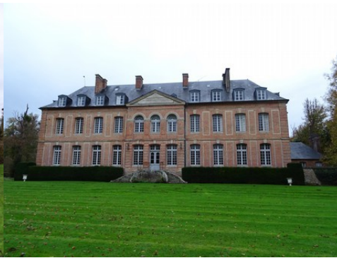
La façade est du château