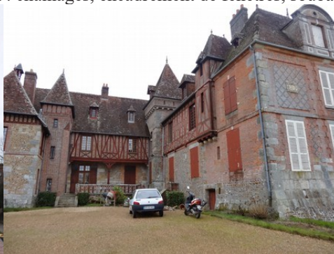
Le château de Cernières (voir autre fiche)