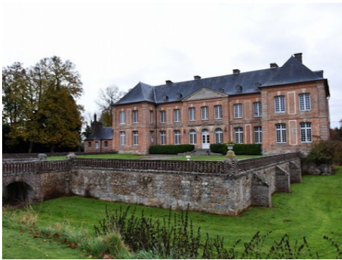
La façade ouest du château