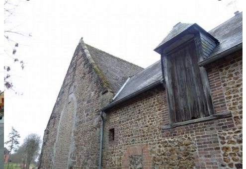
Une maison accolée à l'église (détail)