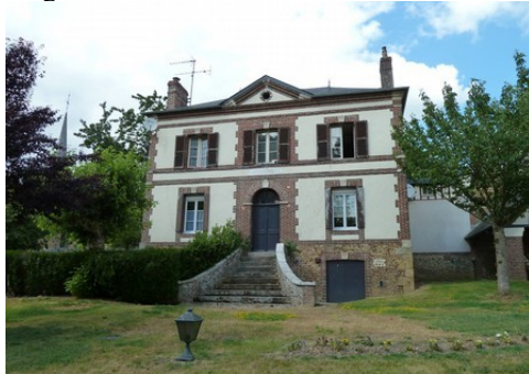
Quelques maisons du village